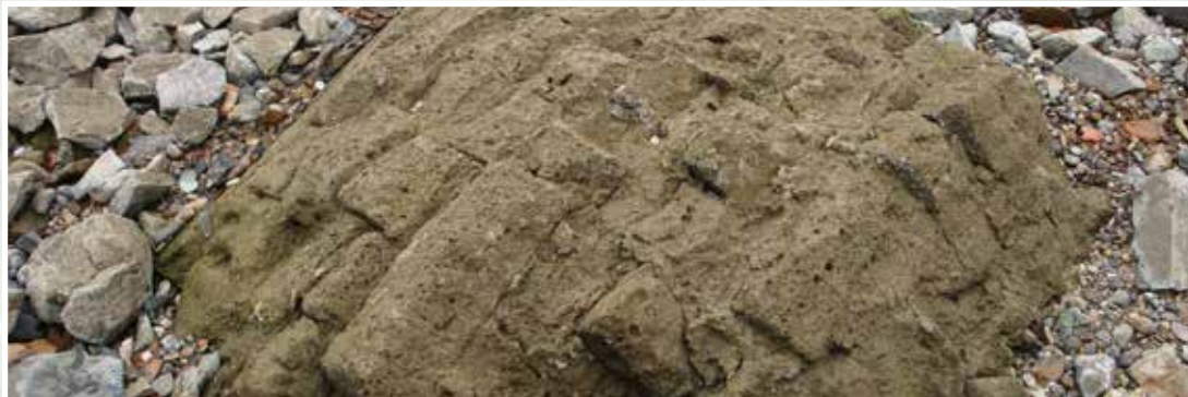
Mauerbrocken der Sprengungen an der Kaiserpalz vor 350 Jahren